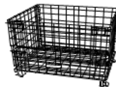
ボックスパレット