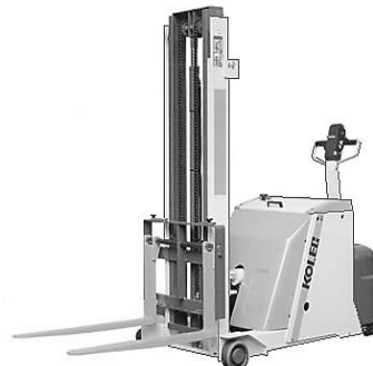
FX カウンターバランス型スタッカー