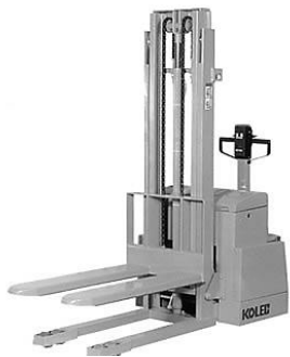
SHPC パレットスタッカー

最大積載荷重は、0.4 tから 1.5 t。パレットスタッカー、ストラドルスタッカー、カウンターバランス型スタッカーとフルライン。搬送機に合わせて作業するのではなく、作業に合わせて搬送機を選んでください。フルラインは私たちの誇りです。