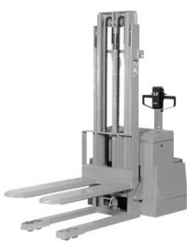
パレット・スタッカー SHPC09W