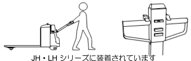
JH・LHシリーズに装着されています

ハンドルを倒して走行するベーシックタイプ。 コレックのハンドルは、車体の上部にありますから 短く、ハンドルが邪魔になりません。