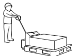
EK・EXシリーズに装着されています

フォークの昇降操作と電動走行時の操作を兼用 したハンドル。シンプルで、走行操作も簡単。